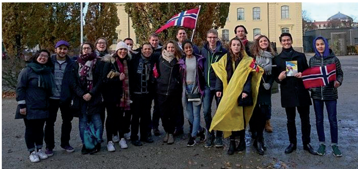
Den norske NUK-delegasjonen i Malmö, klare for messe med Pave Frans

■ Søndag 30. oktober reiste 18 unge voksne katolikker fra Oslo til Malmö for å ta imot Pave Frans, som gjestet Norden for aller første gang.