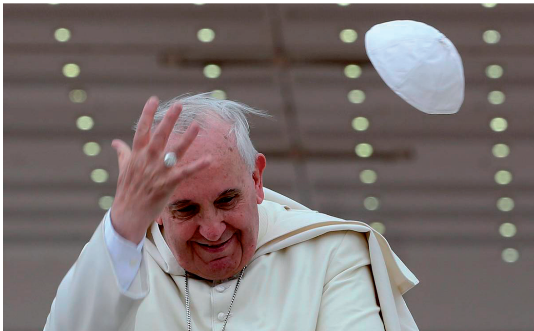
Pave Frans med sin hvite zucchetto, i en noe utradisjonell positur :)

Som så mye annet i Kirken kommer zucchettoens farge an på bærerens rang. Diakoner og prester får svart, biskoper rosa, kardinaler rød, og paven får hvit.