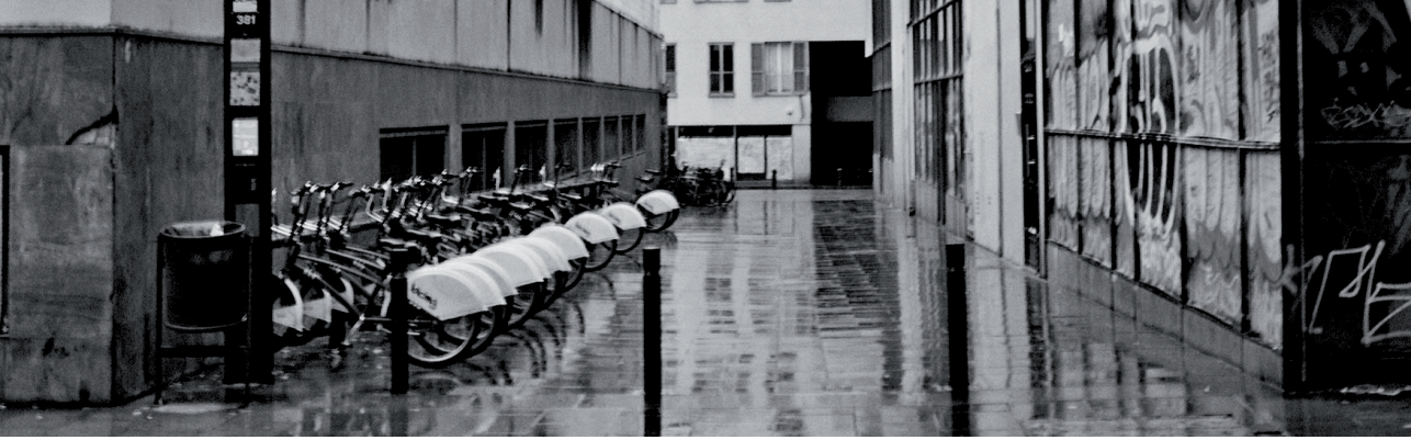
Har det regnet...?

han sier at "The two fundamental tenets of true atheism [are] one: There is no God [and] two: I hate Him.") Slike mennesker vil ikke nødvendigvis finne trøst eller ro i en filosofisk samtale om argumentet fra ondskap. Det er ikke fordi motsvarene til argumentet er dårlige, men fordi de ikke først og fremst er beregnet på å trøste eller berolige.