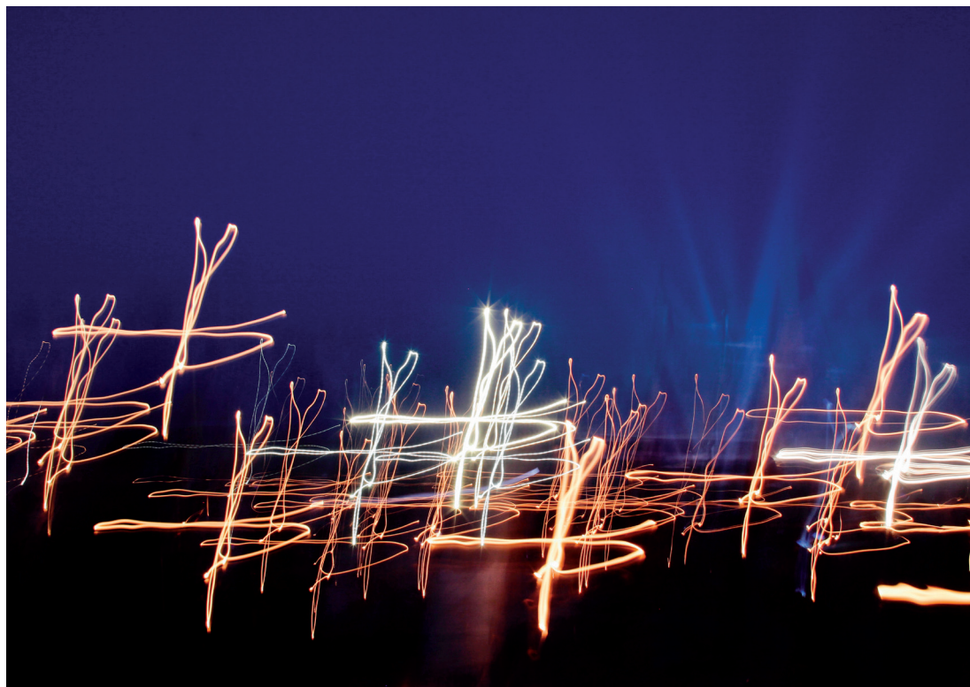
Fra vigilien på Campus Misericordiae under Verdensungdomsdagen i Krakow, sommeren 2016