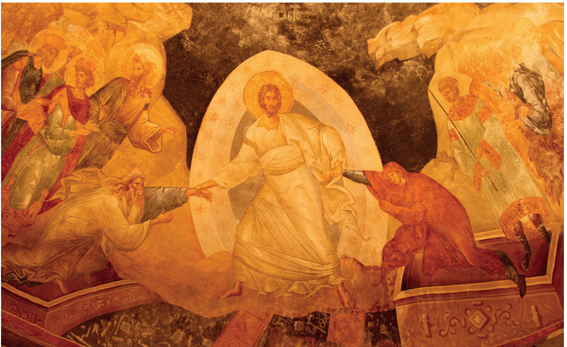
Veggmaleri fra Kariye Camii, Istanbul

Aristoteles' metafysikk ble videreført av Thomas, og er igjen en videreføring og omarbeiding av metafysikken til Aristoteles' lærer, Platon.