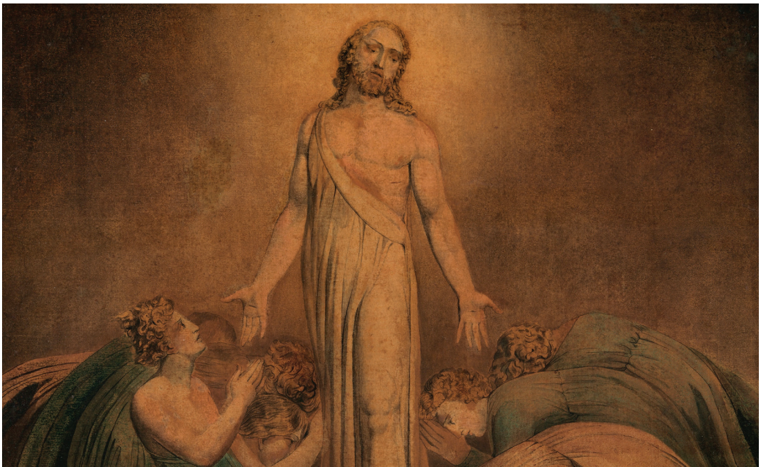
Jesu gjenoppstandelse, William Blake

en slik tilværelse vil være avkortet og avstumpet. Derfor er en slik tilværelse også uforenlig med frelsens formål, som nettopp er å kurere sykdommen som infiserte menneskenaturen ved syndefallet, slik at den igjen kan folde seg fullt ut – ikke å forvandle oss til noe nytt, men å gjøre oss til de vi er.