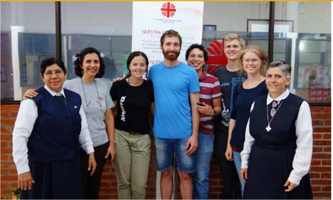
Oss sammen med noen skikkelige fredshelter