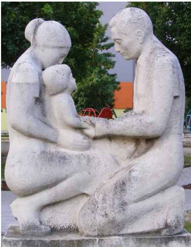
Parents and child

■ I dag er barneoppdragelse noe helt annet i Norge enn det var for bare et par generasjoner tilbake. Lydighet var tidligere et veldig viktig begrep, og lydige barn var idealet. Mor og far ga beskjeder, og barna skulle adlyde. Snille barn var barn som gjorde det foreldrene sa, og som ellers var søte og stille.