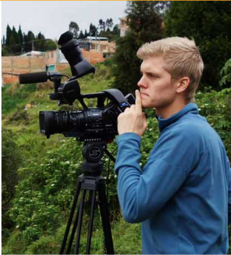
Forfatter - Prestestudent og filmregissør

dem - men nå står jeg her, uten å se at det på noen som helst måte kan være en mening bak dette, og har ingen andre å være sint på enn Han som har skapt alt. Han jeg reiste halve jorden rundt for å tjene og pådro meg en livsforandrende infeksjon. Har jeg lov til å være sint på Gud?