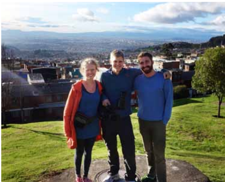
Dreamteam på tur. Utsikt over sørdelen av Bogota

Sommeridyllen ble brutt, skriver sr. Anne Bente, da et fly ble skutt ned over Ukraina, krigen mellom Hamas og Israel blusset opp og IS begynte halshuggingen av vrangtroende i Irak. Da terroralarmen også gikk i Norge, ble vi minnet på hvilken verden vi tross alt er en del av. For øyeblikket er det omkring tretti blodige konflikter som pågår og over femti millioner mennesker som har måttet flykte fra sine hjem.