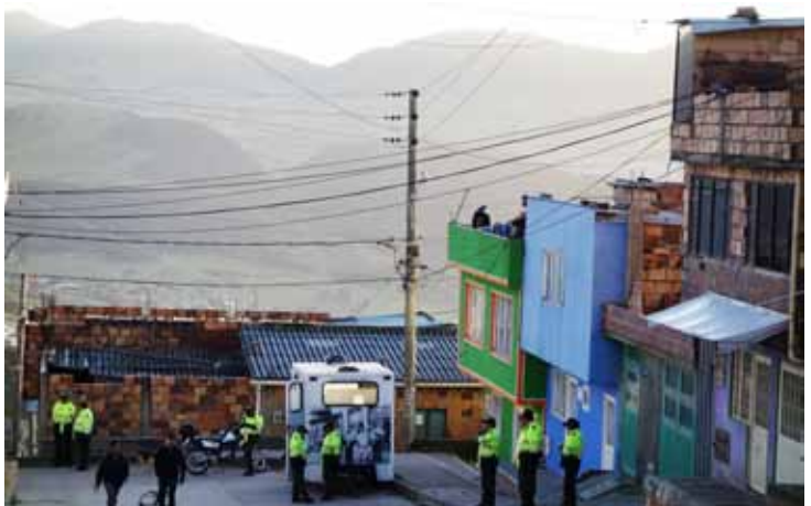
Rett etter at bildet ble tatt, kom det ytterligere 8 tungt væpnede politimenn utenfor huset til et av intervjuobjektene våre

definerer fred som en prosess der liv blir forsvart. Hvordan kan vi da akseptere at nær femti millioner uskyldige barn blir tatt livet av i 2014 - som oftest med myndighetenes «velsignelse» - allerede før de blir født?