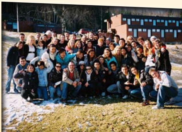
Påskeleir for konfirmerte på Mariaholm.

Omlag seksti deltagere og ledere var samlet i påsken. Leirprogrammet inneholdt mange av de tradisjonelle leiraktivitetene som Rød og Blå, P-OL, korsvei og underholdning. I tillegg hadde vi noen nye ting som for eksempel sjørøverfest med skattejakt. Påsken, som er en sorgens og gledens høytid i Kirken, fikk i år et tilsnitt av brutal realitet da vi mottok beskjeden om biskop