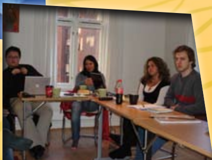
Leirsjefsamling 2008.