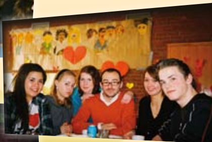
Fra Påskeleir 16+.