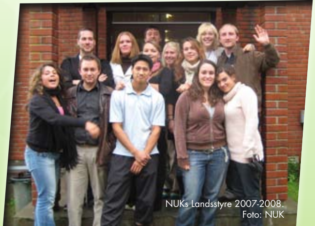
NUKs Landsstyre 2007-2008.