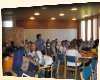
Fra Landsmøtet 2007.