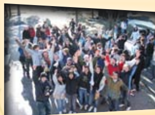
Konfirmantleir på Oksnøen i Råde.