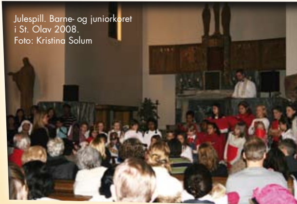
Julespill. Barne- og juniorkoret i St. Olav 2008.