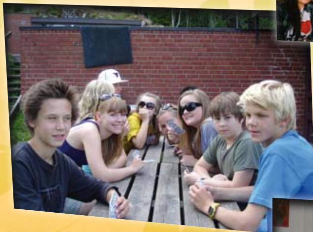
Juniorleir 2008.