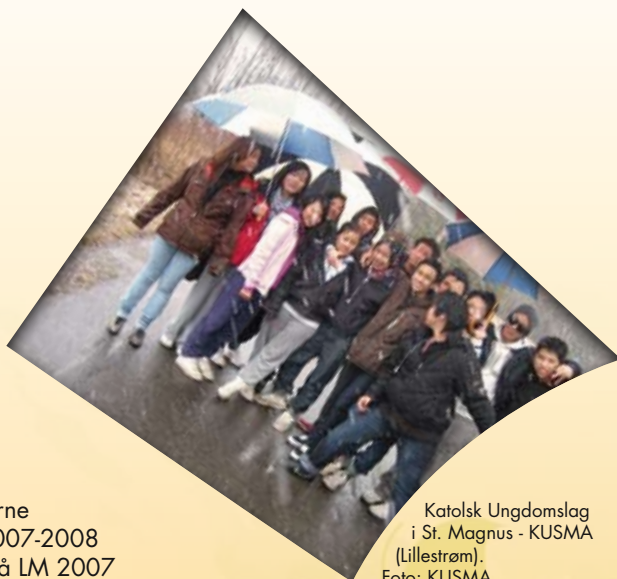
Katolsk Ungdomslag i St. Magnus - KUSMA (Lillestrøm).