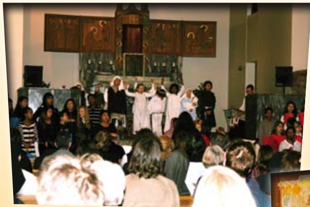
Julespill i St. Josephs kirke, Oslo.