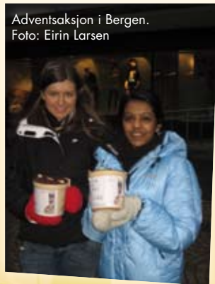
Adventsaksjon i Bergen.

antall deltagere. Her fikk delegater fra mange forskjellige lokallag i NUK komme til Mariaholm og lære om historien bak situasjonen i Nord-Uganda, Caritas' prosjekter som Adventsaksjonen skulle støtte, og om praktiske tips knyttet til selve innsamlingssituasjonen.