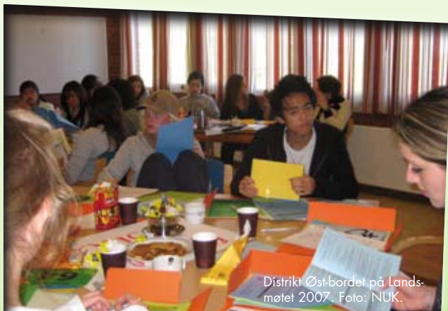
Distrikt Øst-bordet på Landsmøtet 2007.

Landsmøtet fordelte seg senere i flere arbeidsgrupper som hadde i oppgave å evaluere tidligere arbeid, og se fremover. Dette var arbeidsgruppene ved LM 2007 og noen av de tankene som kom frem: Ledertreningene (Gruppen gjennomgikk LTUs oppgaver samt andre oppgaver og verv i NUK.) , Leirene (Leir er en av NUKs viktigste og mest sentrale arrangementer. Spørsmålet gruppen stilte seg var: Hvordan kan leirene forbedres? ), Karitativt arbeid og Adventsaksjonen (Karitativt arbeid er en stor del av troen vår, det kan vi ikke se bort i fra. Men man skal ikke gjøre det fordi det står i NUKs arbeidsprogram, men fordi det er en viktig del av troen vår.), Støtte til menighetene og lokallag fra NUK sentralt (De som har vært med på leir er ofte mer aktive i menighetene og lokalt enn de som